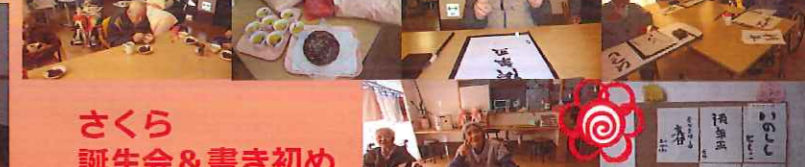
さくら誕生会 & 書き初め