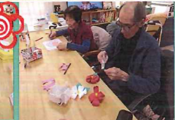
きれいなお花が出来ました