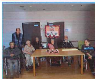
りんどうお誕生会 & 福笑い