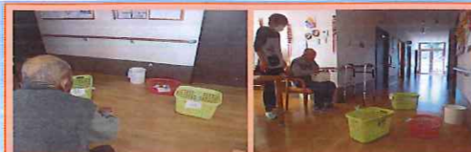
ひまわり・玉入れ