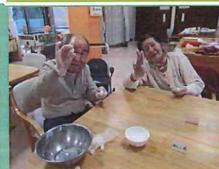
手作りぜんざい 美味しくなあれ