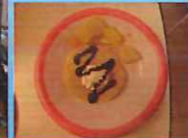
さざんかお誕生会