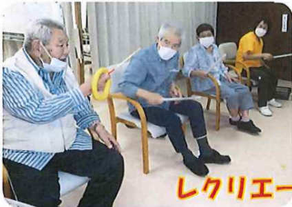
レクリエーション中☆

楽しく健康で過ごして頂けるよう、職員一同、利用者様皆様のお越しをお待ち致しております。