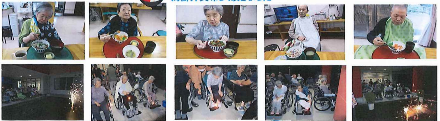
季節外れの花火大会