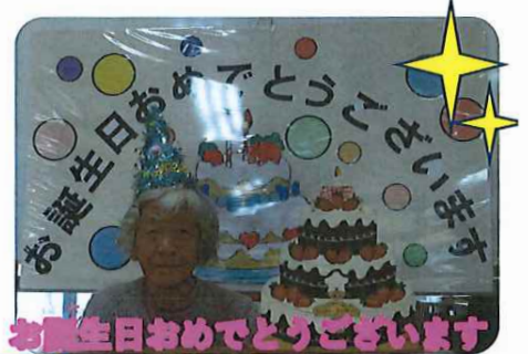
お誕生日おめでとうございます