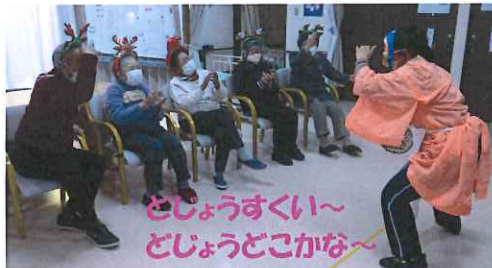
どじょうすくい～ どじょうどこかな～