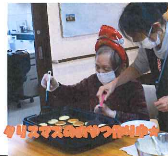
クリスマスのおやつ作り中☆

松の内も過ぎ、ご利用者様ご家族様にはご清励のことと拝察致します。 寒さも佳境に入り、利用者様皆様の装いもさらに念入りになっています！脱ぎ着も大変になり、お手伝いさせて頂いておりますが、苦戦される様子が見受けられます。今年はデイサービスで手や足の筋力アップを目指し、レクリエーションや体操で着脱をよりスムーズにできるよう、楽しく体を動かしましょう！皆様のお越しをお待ちいたしております。